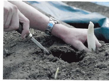
Afb. 2.74 Omdat asperges meerjarige planten zijn en ze in de grond groeien, is het technisch gezien moeilijk om ze machinaal te oogsten.

2.28 Wanneer oogst een kweker zijn gewas handmatig?