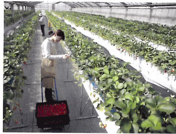
Afb. 2.73 Omdat aardbeien kwetsbaar zijn, worden ze met de hand geoogst.