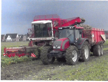
Afb. 2.72 Bieten zijn stevige producten en ze staan op een groot perceel. Hierdoor kunnen bieten machinaal worden geoogst.