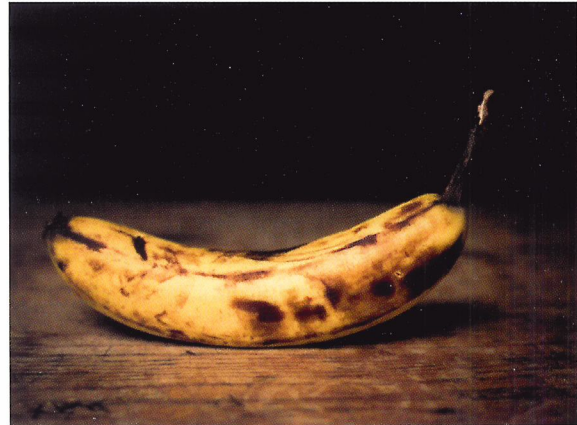
Afb. 2.65 Zou jij deze overrijpe banaan kopen in de winkel?

Koop jij een bos rozen als ze volop in bloei zijn? Of een bruine banaan? Nee, want deze producten zijn overrijp. De rozen blijven niet lang staan op de vaas en de banaan is niet lekker meer. Voor een kweker is het belangrijk dat hij op het juiste moment oogst, zodat de producten vers zijn en met de juiste rijpheid verkocht kunnen worden. Elk gewas 'verraadt', door bijvoorbeeld z'n kleur of smaak, wanneer het juiste oogstmoment is aangebroken. Als je weet waarop je moet letten, kun je zelf het juiste oogstmoment bepalen.