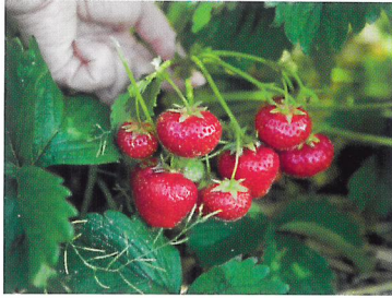
Afb. 2.69 Een aardbei is oogstrijp als hij mooi rood is en zoet van smaak.