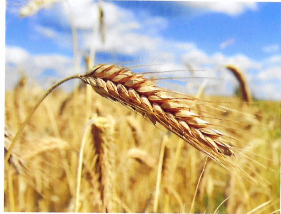
Afb. 2.68 Het oogstbare deel van graan is het zaad in de aar.

2.26 Wat zijn de oogstbare delen van een zonnebloem?