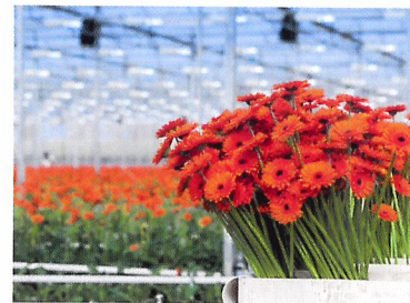
Afb. 2.71 Een gerbera is oogstrijp als de bloem volledig open is.

2.27 Waar houdt een kweker rekening mee als hij het tijdstip van oogsten bepaalt?