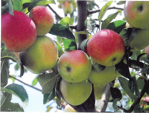
Afb. 2.67 Het oogstbare deel van een appelboom is de vrucht.