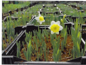
Afb. 2.70 Vlak voor Pasen is er veel vraag naar voorjaarsbloemen. Narcissen leveren dan een goede prijs op.